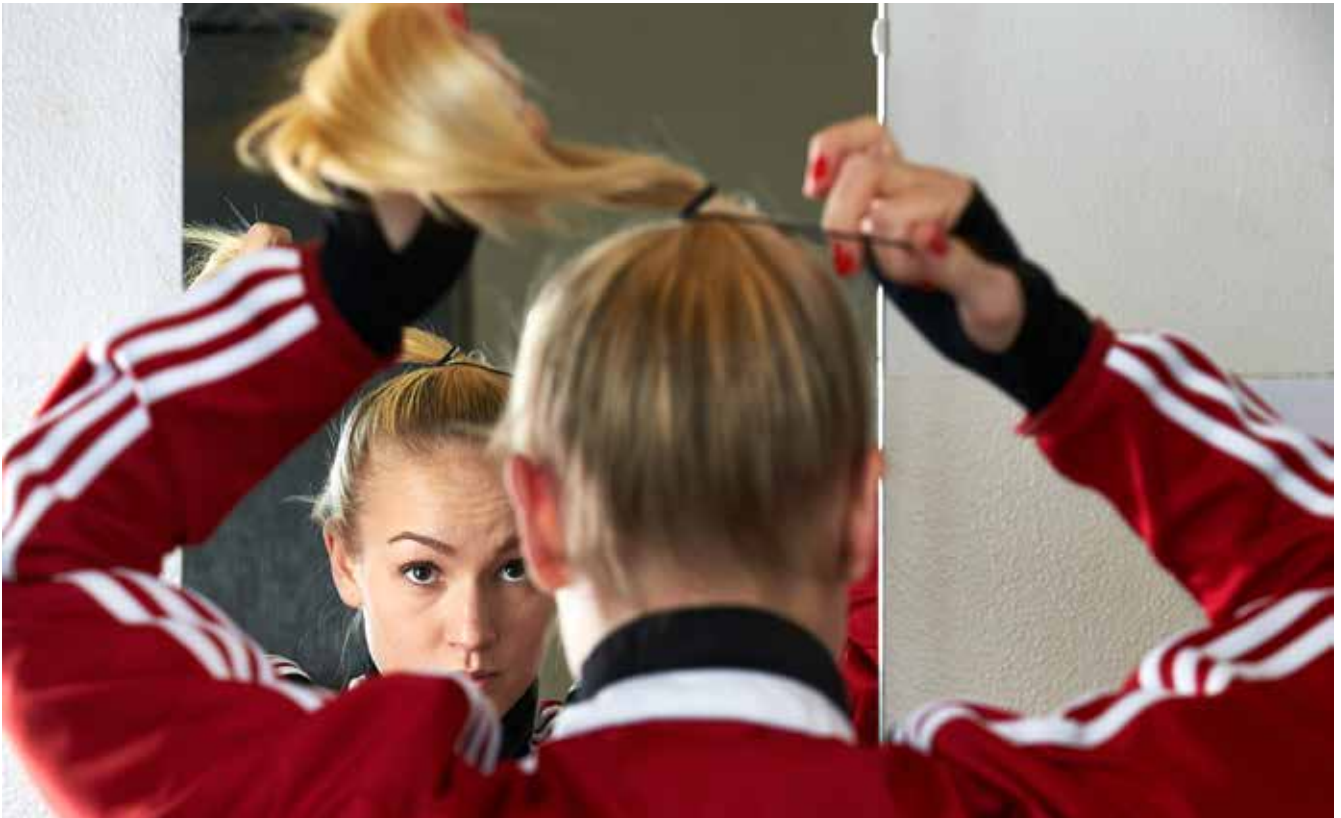
Fodbold er Danmarks største sportsgren for piger. Som moderne pige/kvinde kan man sagtens spille fodbold og blive beskidt og så bagefter tage stiletter og fin kjole på.